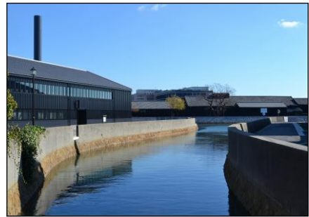
▲半田運河周辺の景観

ソフト事業のベースである「はんだ蔵のまちネットワーク」（事務局：NPO 法人半田市観光協会）の月例情報交換会への参加者は、平成 20 年 10 月の発足当時の 2 倍以上になり、半田運河周辺の賑わい創出のため、活発な情報交換が行われています。