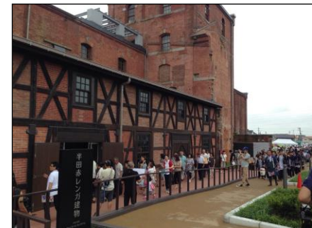
▲再整備オープン時の様子