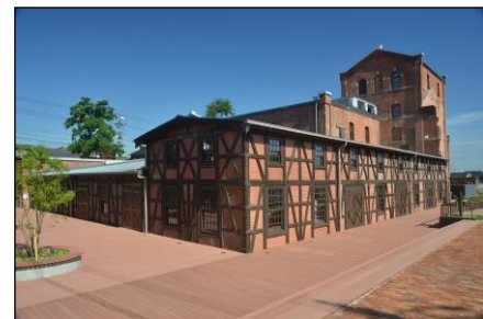
▲常時公開が可能となった半田赤レンガ建物