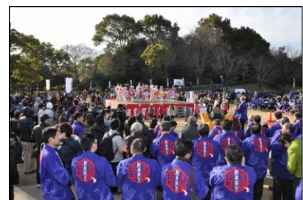
▲新美南吉生誕 100 年記念事業 開幕祭