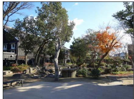
▲半田運河の観光拠点となる半六庭園