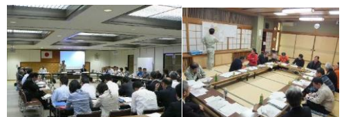
▲観光まちづくり計画策定に向けた会議 および地域住民とのワーキングの様子