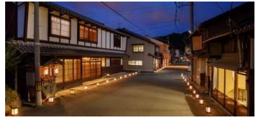
▲小浜西組重要伝統的建造物群保存地区

小浜西組が平成 20 年に重要伝統的建造物群保存地区に選定され、家屋の修理・修景も進んできました。電線地中化を始めとした整備により、縁日イベント「町家 de フェスタ」や、「町家 de 祝言」などのイベントがますます町の風情に似合ってくるのではと期待しています。今後もこうしたイベントなどを通じて、小浜西組の良さを多くの方に知っていただけるよう、頑張っつてゆくつもりです。