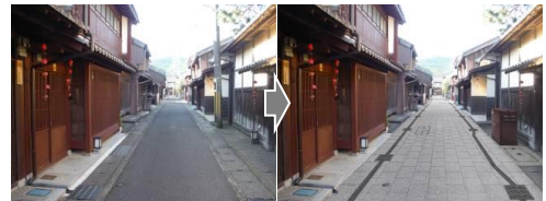
▲市道柳町線（三丁町）整備イメージ