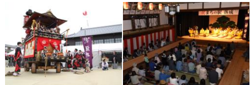
▲まちの駅オープニングイベントの様子