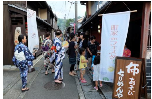
▲町並みを活かした縁日イベント 「町家 de フェスタ」