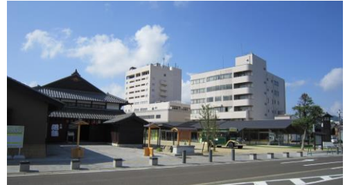
▲全国で 30 ほど、県内唯一の現存する芝居小屋「旭座」を移築した「まちの駅」