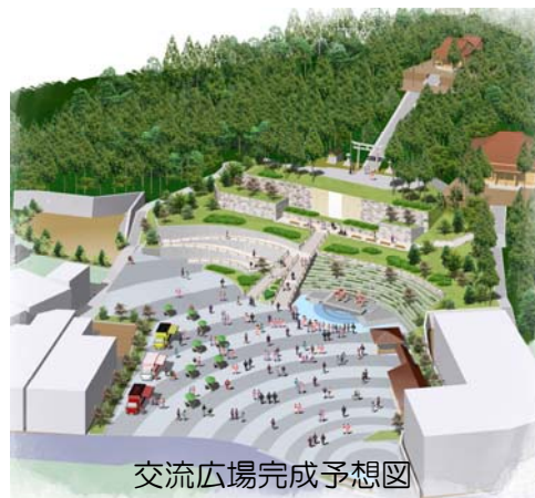
交流広場完成予想図