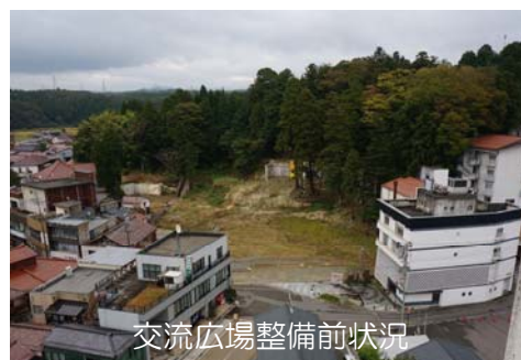
交流広場整備前状況

粟津町を含むこの周辺地区にとって、粟津温泉は観光を主とした産業の中心として栄えてきました。温泉街の再生は、周辺に住む地元住民にとっても、最も重要な関心事であり、開湯1300年を迎えるにあたり、地元住民、旅館関係者、市が一体となって温泉街の再生に向けた話し合いが出来たことは、すごく意義があることだと思います。一体となって盛り上げていくという思いを忘れず、粟津温泉が今まで以上に活性化することを期待しております。