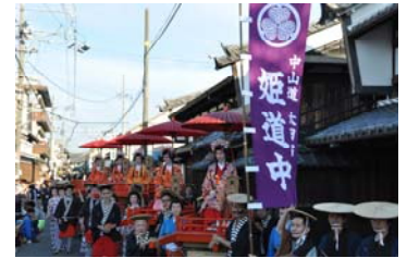
▲おん祭りのかも秋の陣