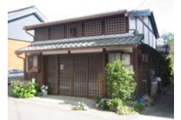
▲中山道まちなみ整備事業