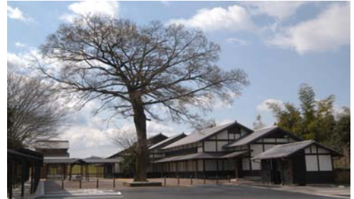
▲太田宿中山道会館