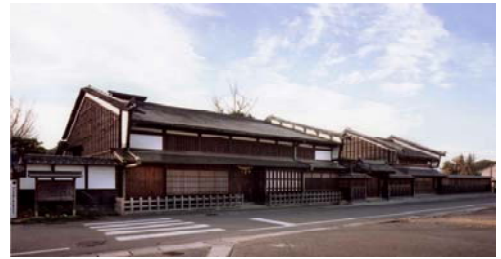
▲重要文化財旧太田脇本陣林家住宅

江戸時代の面影を残す中山道 51 番目の宿場である太田宿をかつての賑わいを戻すため、中山道沿いの商工業者を中心に文化、歴史、景観等守る活動を行ってきました。私たちの夢であった太田宿中山道会館がまちづくり交付金により整備され、NPO法人宿木が市で初めての指定管理者として平成 18 年 4 月から運営管理し、市の魅力を伝える観光・交流・文化施設として年間 30 以上のイベントを開催し集客に努めています。今後は、地域の宝物を磨きだし、他団体との連携や活用により高齢者と若者が交流するまちづくりに取り組んでいきたいと思っています。