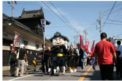
▲大浜てらまちキャラクター 『てらまち小僧』