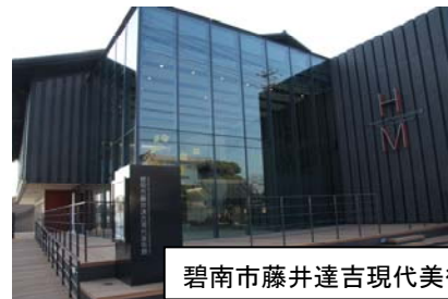
碧南市藤井達吉現代美術館