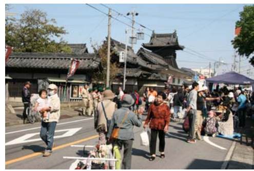
▲大浜てらまちウォーキング

今後は、イベントのみならず、日常的に大浜地区を訪れる人達を楽しませ、地域住民の皆さんが誇りの持てるまちになればと考えています。