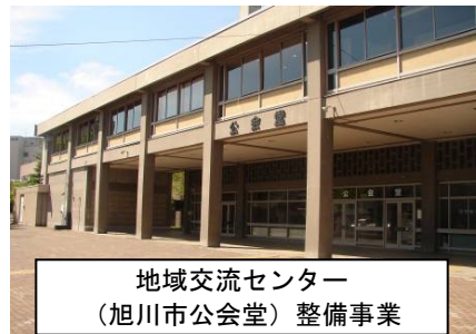
地域交流センター (旭川市公会堂) 整備事業