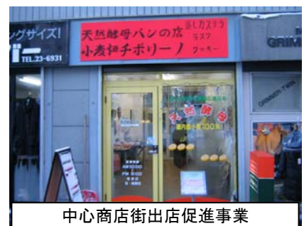
中心商店街出店促進事業