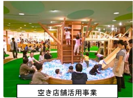
空き店舗活用事業

このたび、旧丸井今井旭川店の空き店舗を活用した公共空間の整備をはじめ、北彩都あさひかわ整備事業などの取組が評価されましたことは、大変喜ばしいかぎりであり、今回の受賞を契機に更に関係機関・団体等との連携を密にしながら、中心市街地の活性化に寄与するよう努めて参りたいと考えております。