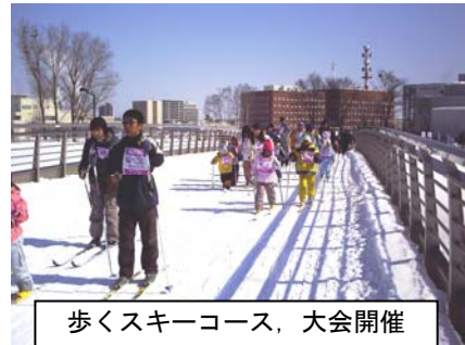
歩くスキーコース、大会開催