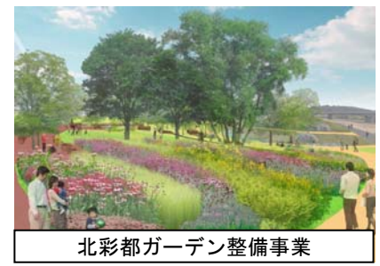
北彩都ガーデン整備事業