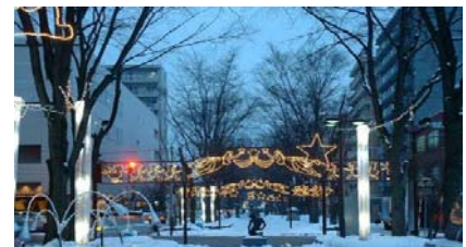
街あかりイルミネーション設置事業