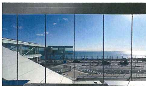
駅コンコースからの眺め

その結果、これまで単なる通過点であった駅が、多様な交流を育む交流拠点として訪れた人々の記憶に残り、明日への生きる活力を与える場所となった。