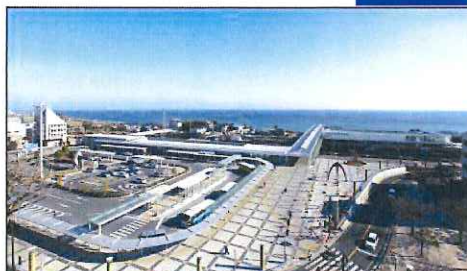
一体的で魅力ある空間となった日立駅周辺

また、老朽化し、バリアフリー化の対応が必要になっていた日立駅を含めた関連施設の整備が日立市及び市民の長年の課題となっていた。