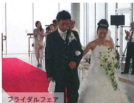
ブライダルフェア

多くの関係者の努力により様々な障壁を乗り越えて完成した日立駅周辺地区は、現在、本賞の受賞をはじめ市内外から高い評価を得ています。本事業を本市におけるまちづくりの成功事例と捉え、今後とも市民が誇りを持てるような、創意工夫を活かしたまちづくりを推進してまいります。