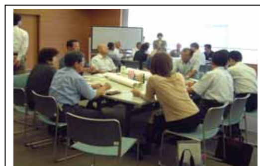
住民参加によるワークショップ