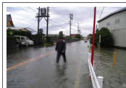
大雨による冠水箇所

ハード整備が終わったあとにおいても今以上に積極的なコミュニティ活動を継続させて、新しい夢のある地域が創造されていくことを期待しております。