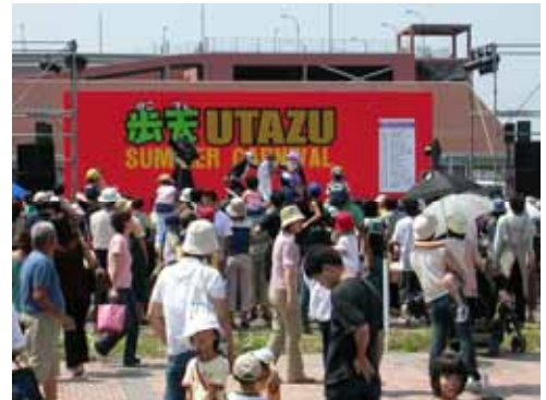
住民団体の主催によるイベントの様子