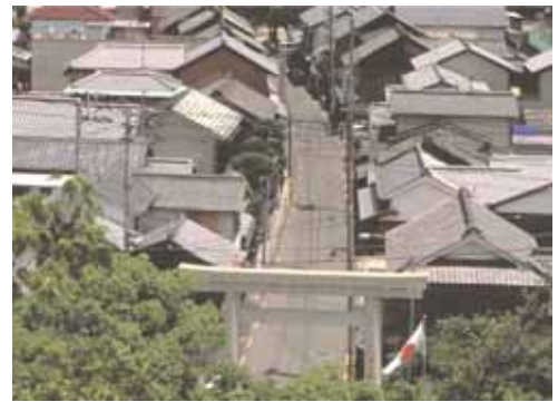
旧市街地の街並み