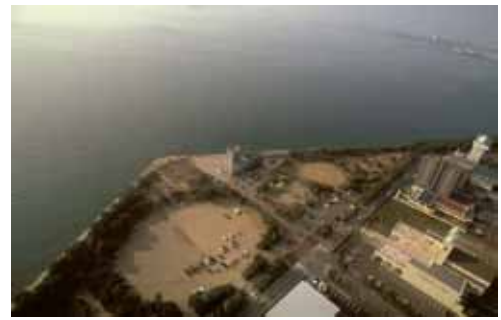
宇多津臨海公園現況写真

・「そこに暮らしている住民にとって、暮らしやすく誇りに思うまちづくり」を念頭に、住民との協働により計画を策定いたしました。計画を遂行する中で、住民のまちづくりへの意識が一段と高まっていくと確信しています。