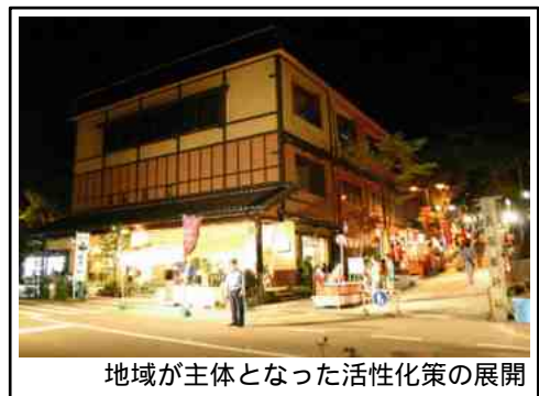
地域が主体となった活性化策の展開