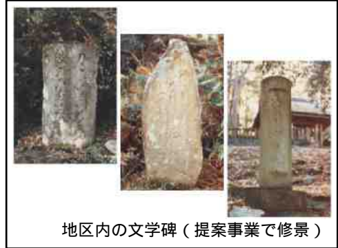
地区内の文学碑（提案事業で修景）