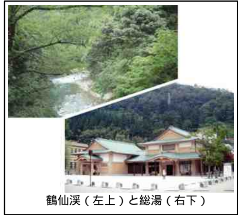
鶴仙溪（左上）と総湯（右下）

ソフト面のまちづくり活動においても、「1店舗2業種の店づくり」や「商店のギャラリー併設」、「空き店舗を活用した体験どころ（伝統工芸・芸能体験）」の取り組みなど、住民・事業者が主体となった独自の活性化策が展開されている。