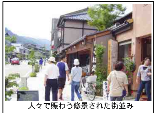
人々で賑わう修景された街並み